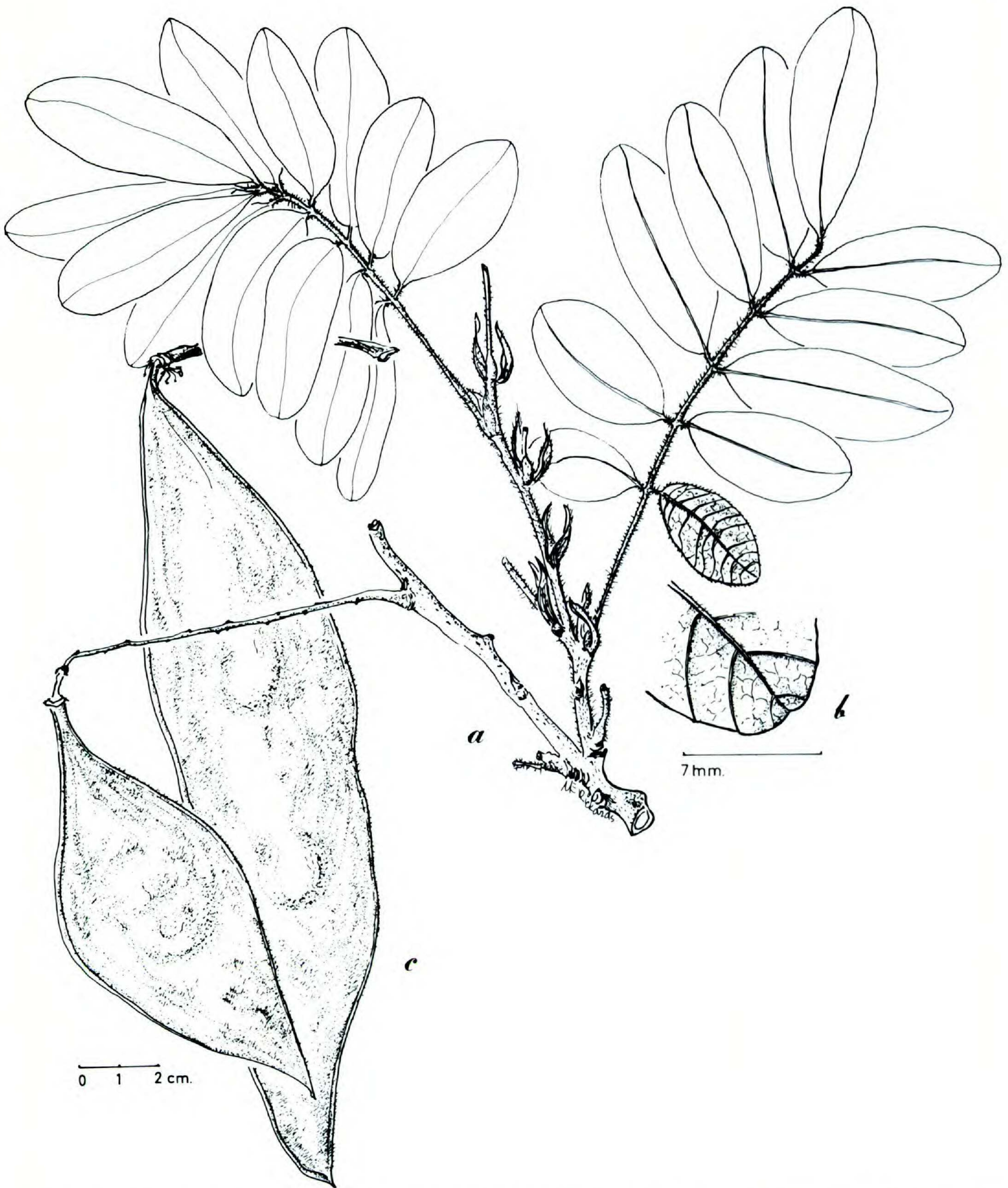
FIGURE 3. Lonchocarpus pilosus .—a. Rama con infrutescencia.—b. Detalle nervación.—c. Fruto. La infrutescencia y detalle de la nervación tomada de H. B. L. Evans s.n. y el fruto de W. D. Stevens 23155.

Distribución. Sólo de Nicaragua en Matagalpa y Chontales, en bosque premontano muy húmedo, en ocasiones ripario, entre los 350 y 1,200 m de altitud. Fructifica de mayo a diciembre.